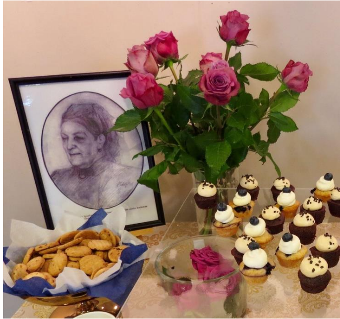
Aurora- syntymäpäiväjuhla Pikku Aurorassa 1.8.2017