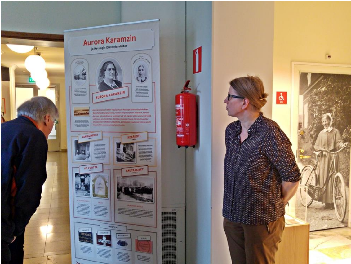
Vierailu Diakonissalaitoksella 22.3.2017